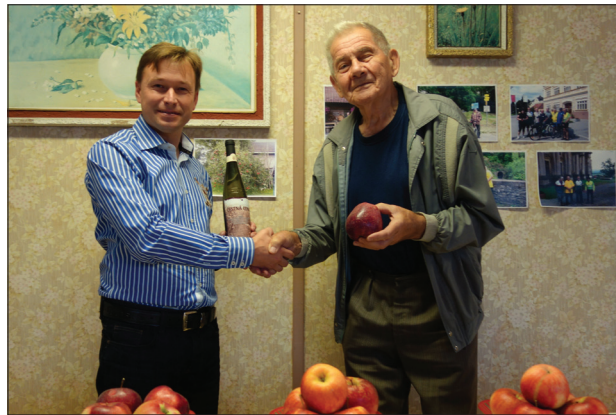
Vyhodnocení jablka 2018