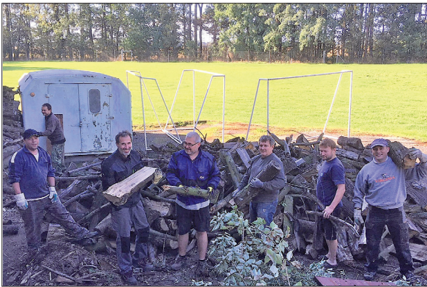
Podzimní brigáda 2018