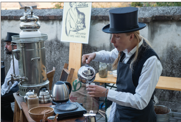
Historická pražírna kávy