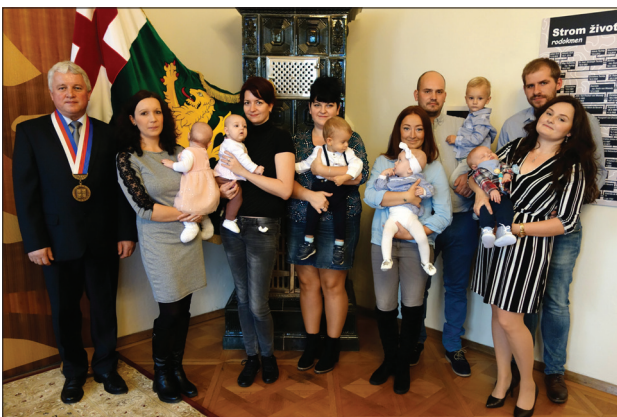
Vítání občánků 2018